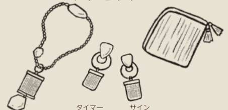
タイマー サイン Timer & SIGN